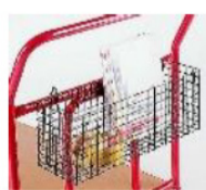
Panier à fil 802 000 002