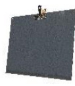
Porte document A3 couché 802 000 010