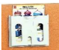
Porte document plastique autocollant 802 000 001