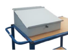
Pupitre avec écritoire verrouillable 882 006 039