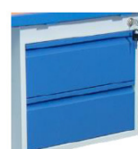
2 tiroirs supplémentaires, livré monté 882 006 038