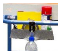
Porte document et bouteille 802 009 529